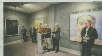
Imagen de premios del Francisco Pedraja en la sede de la Fundación CB ayer.

El premio de pintura Francisco Pedraja ampliará sus donaciones